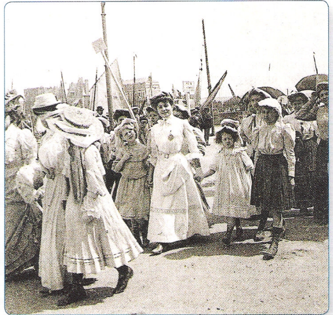
Ces jeunes parisiennes chanteront l'Internationale dans les rues du Tréport

Le 1er mai sera sous haute tension dans le Vimeu et dans la vallée de la Bresle. La troupe garde les usines et les entrées des communes. Elle charge les ouvriers à Escarbotin. Suivant le mot d'ordre national de la CGT, certains ouvriers essaient d'imposer la limite de huit heures de travail par jour dans leurs usines. L'intransigeance des patrons les fait rapidement plier.