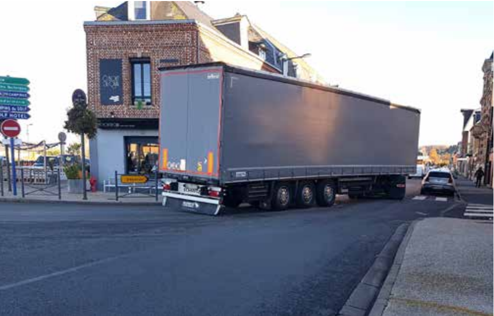
Chaque jour, des dizaines de poids lourds passent quai de la retenue et avenue des Canadiens. La desserte portuaire supprimerait ce problème.

La réglementation prévoyant que, faute d'unanimité lors d'un premier vote, le PLUIH est de nouveau présenté. Il suffit alors de réunir une majorité de voix aux 2/3. Le PLUIH a donc été adopté. Il va faire l'objet d'une enquête publique et devra être validé par les services de l'État. Les études d'impact et environnementales se poursuivent, mais la voie portuaire demeure pour le moment dans les cartons.