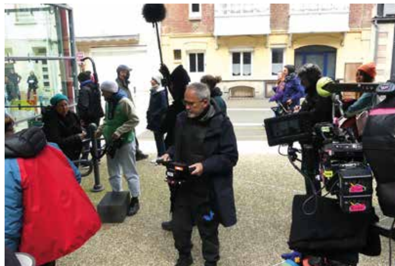
Jérôme Cornuau, le réalisateur.

prolifère réalisateur tant à la télé qu'au cinéma. La diffusion est envisagée pour la fin de l'année 2026.