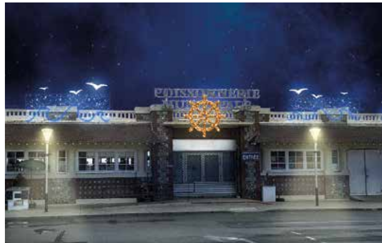
La Poissonnerie, point de départ du parcours.

La participation est gratuite et peut se faire à tout moment. Il convient d'être muni d'un smartphone et d'une application de lecture des QR codes (de nombreuses applications gratuites peuvent