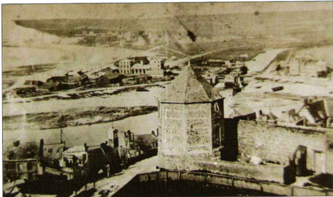
La tour telle qu'elle se présentait à la fin du XIX ème siècle

Les actes notariés nous permettent de connaître les derniers propriétaires de cette